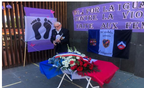
11 novembre à Alicante