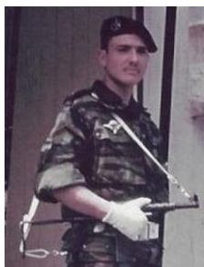
Garde d'honneur à la villa du général CHALLE