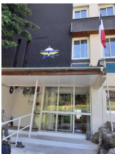
Le poste de montagne